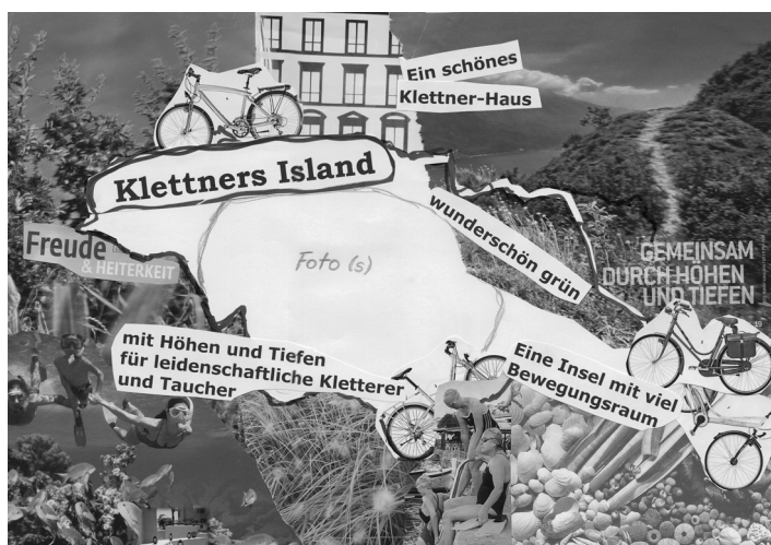
Abb. 36: Insel-Collage der Familie Klettner

Familie Klettner gestaltete ihre Insel gemeinsam als Collage. In der Mitte blieb Platz für eigene Fotos. Diese Fotos sind Zukunftsfotos,