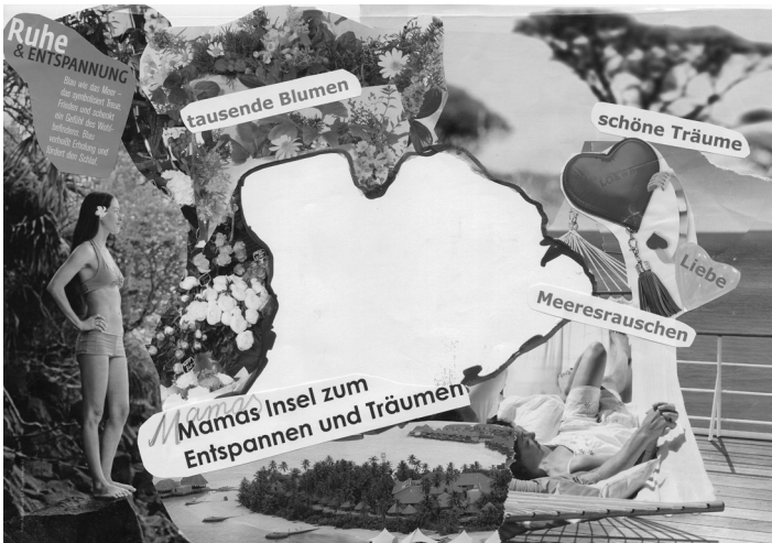
Abb. 37: Maxima gestaltet »Mamas Insel«

Maxima ist acht Jahre alt und lebt mit ihrer Mama. Zusammen mit mir gestaltet sie eine Insel für ihre Mama, und ihre Mama entwirft Maximas Insel. Sie können gut erkennen, welche Wünsche Maxima bei ihrer Mutter wahrnimmt und umgekehrt. Es entstehen Beschreibungen der beiden Persönlichkeiten durch Bilder. Dies sind wunderbare Gesprächsgrundlagen. Auch hier bleibt Platz für Fotos, die entstehen werden. Ein Kernthema »Die Ausschau nach Dritten« hat inzwischen viele Köpfe bekommen. Die Beziehung